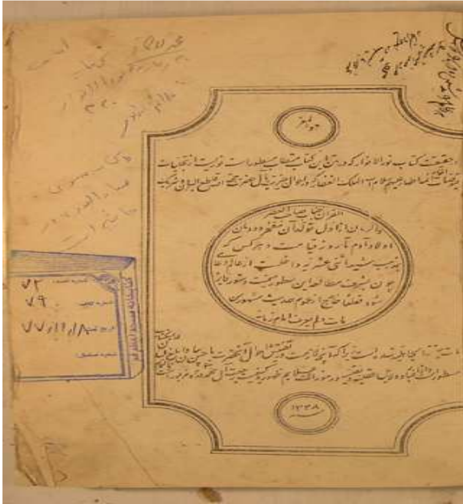
پیوست شماره ۲. عکس آخر کتاب